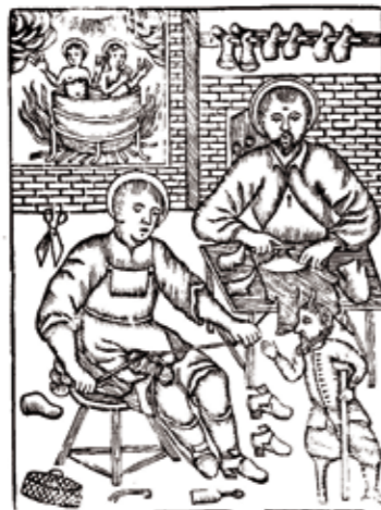
Santos patronos del oficio de zapatero, San Crispín y San Crispiniano. Estampa popular.

El edificio, rehabilitado como museo, fue inaugurado el 2 de junio de 2010 y abarca un espacio de amplias dimensiones que se articula en dos plantas rectangulares, una principal destinada a sala de exposiciones temporales, almacén y despachos, y un primer piso que recrea una fábrica de calzado con herramientas mecánicas de las diferentes labores de su proceso de producción utilizadas en Inca en la primera mitad del siglo XX.