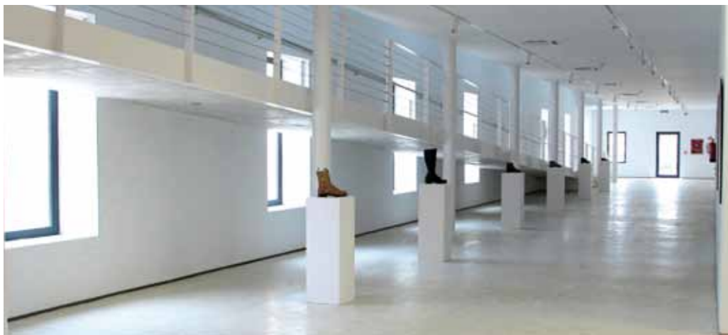
Sala de exposición de la planta baja