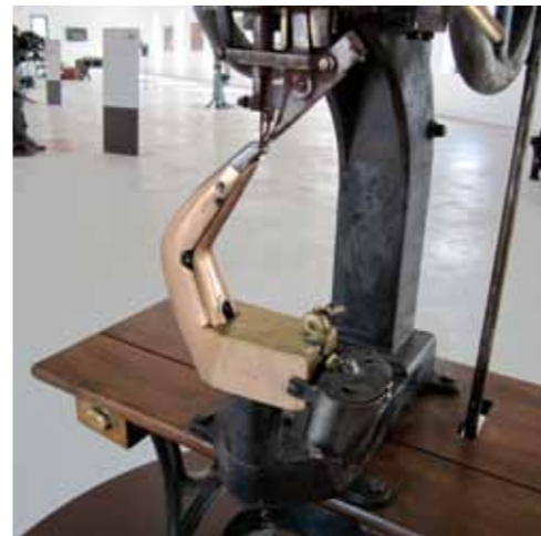
Sala de exposición del museo. Maquinaria de producción de calzado de Inca en la primera mitad del siglo XX

La finalidad es subrayar la importancia del calzado como complemento indispensable de la indumentaria, y por tanto de la evolución del traje, distinguiéndolo como indicador fundamental del hombre civilizado en cuanto que envoltura del pie desnudo, y por añadidura, también como dictaminador de la moda y por tanto vinculado al mundo de la creación artística.