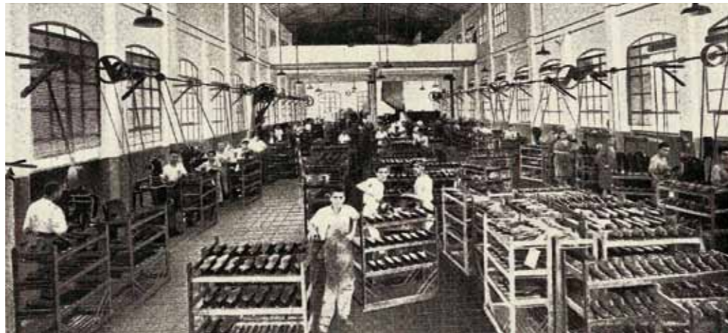
Recinto de trabajo de la fábrica Melis de calzado de Inca (ca. 1930)