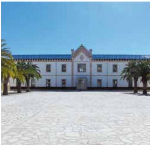
Antiguo pabellón militar, actual sede del museo del calzado