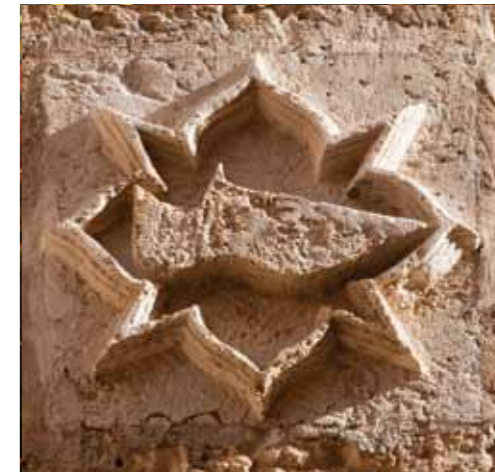
Emblema medieval del gremio de zapateros de Mallorca