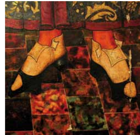
Calzado masculino en la Edad Media. Detalle del retablo de San Cosme y San Damián (autor anónimo. Mallorca, siglo XV)