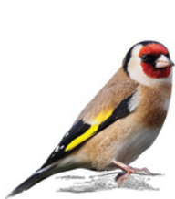
Cadenera jilguero europeo European Goldfinch Carduelis carduelis