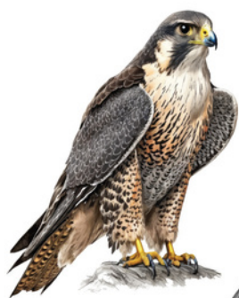
Falcó peregrí Halcón peregrino Peregrine Falcon Falco peregrinus