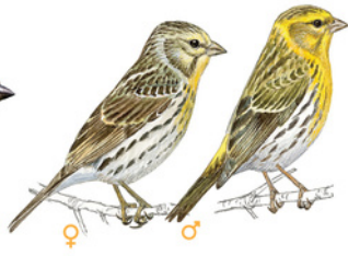
Gafarró Serín verdicillo European Serin Serinus serinus

Trets diferenciadors: - El bec és curt. - La coa és llarga i escotada. - Té el dors castany, el cap gris i les ales negres. - Presenta la gola llistada i les dues plomes externes de la coa de color blanc. Dimorfisme sexual: - Els mascles durant la primavera tenen el front i el pit de color vermell. Longitud: 13 cm Envergadura: 21 - 25 cm