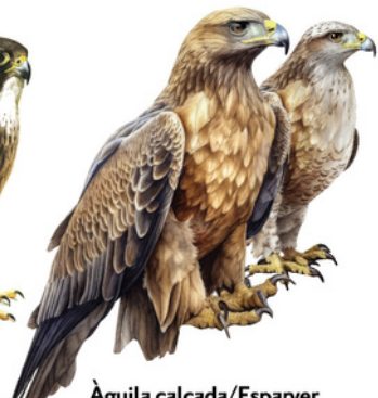
Àguila calçada / Esparver Águila calçada comuna / Águila calzada Booted Eagle Hieraaetus pennatus

Trets diferenciadors: - Exemplar adult amb plomatge clar: - Presenta les zones superiors de color marró obscur. - Les calces i ventre són de color vermellenc i barrats. - Té les galtes pàl·lides i travessades per una bigotera marcada. Adults amb plomatge obscur: - El plomatge és completament negre, més intens al dors, i les plomes de vol de les ales i la coa són més clares. Dimorfisme sexual: la femella és més grossa. Longitud: 35 - 44 cm Envergadura: 84 - 103 cm