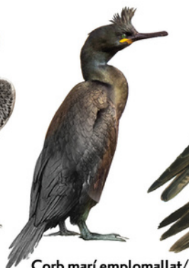
Corb marí emplomallat / Corb marí Cormorán moñudo European Shag Gulosus aristotelis

Trets diferenciadors: - Té les parts superiors d'un to gris pissarra i les voreres de les plomes cobertores lleugerament més clares. - Les plomes inferiors tenen un barrat horitzontal fi que s'estén també per les ales. - Disposa d'un bec poderós i una bigotera extensa que emmarca les galtes blanques i els ulls. Dimorfisme sexual: - La femella és més grossa. Longitud: 38 - 51 cm Envergadura: 89 - 113 cm