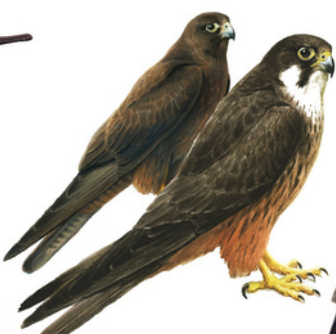
Falcó marí / Falcó de la reina Halcón de Eleonora Eleonora's Falcon Falco eleonorae

Trets diferenciadors: - El coll és més estret que el cap i la gola totalment negra amb la commisura del bec groga. - En període de festeig presenta una cresta corba cap amunt. Longitud: 65 - 80 cm Envergadura: 90 - 105 cm