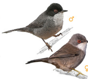
Busqueret de capnegre / Tallarol capnegre Curruca cabecinegra Sardinian Warbler Curruca melanocephala

Trets diferenciadors: - Té un caprirot obscur que li arriba fins davall de l'ull. - Les plomes externes de la coa són blanques. Dimorfisme sexual: - El mascle presenta el pit taronja vermellenc, el dors gris, la gola negra i el front blanc. - La femella té les parts inferiors de tons marró grisenc i el dors més marró. Longitud: 14 cm Envergadura: 22 - 24 cm