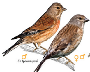
Passerell / Passerell comú Pardillo común Common Linnet Linaria cannabina

Trets diferenciadors: - Presenta una careta vermella, amb taques blanques i negres. - El bec és llarg acabat en punta fina i amb la base ampla. - Té la coa pràcticament negra. Longitud: 12 cm Envergadura: 21- 25,5 cm