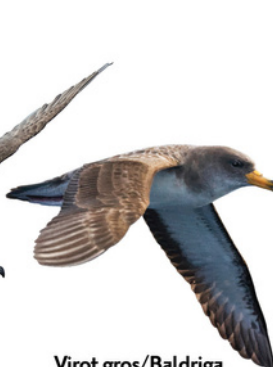
Viot gros / Baldriga cendrosa mediterrània Pardela cenicienta Scopoli's Shearwater Calonectris diomedea

Trets diferenciadors: - Té el cap petit i el bec fi i grisenc. - Les ales i la coa són relativament curtes (les potes solen sobresortir lleugerament per darrere). - Presenta tons bruns a les parts superiors i el ventre i l'interior de les ales són d'un color blanc brut. Longitud: 34 - 38 cm Envergadura: 83 - 93 cm