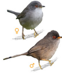
Busqueret coalarg / Tallareta balear Curruca balear Balearic Warbler Curruca balearica

Trets diferenciadors: - Té un caprirot obscur que li arriba fins davall de l'ull. - L'anell ocular és vermell i les potes clares. - Les plomes externes de la coa són blanques. Dimorfisme sexual: - Els mascles presenten les parts superiors de color gris, les parts inferiors més pàl·lides i el cap negre. - Les femelles són més brunes a la part dorsal, amb el ventre més pàl·lid i el cap gris. Longitud: 13 - 14 cm Envergadura: 15 - 18 cm