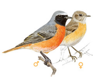
Coa roja / Coxa coa-roja Colirrojo real Common Redstart Phoenicurus phoenicurus

Trets diferenciadors: - Té el cap voluminós, el bec típic d'insectívor i les potes fines i negres. - Presenta colors grisencs al dors; colors blanquinosos al ventre, i la gola, el pit i el front llistats. Longitud: 14 - 15 cm Envergadura: 23 - 25,5 cm