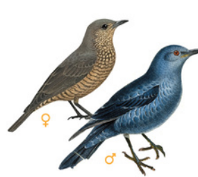
Pàssera / Merla blava Roquero solitario Blue Rock Thrush Monticola solitarius

Trets diferenciadors: - Té una coa llarga. - El dors és de color pissarrós, les parts ventrals són grises més pàl·lides i la gola blanquinosa. - Té l'anell ocular i les potes vermelles. Dimorfisme sexual: - Les femelles tenen la coa més blanquinosa i presenten el cos amb tons grisencs més clars. Longitud: 13 cm Envergadura: 13 - 18 cm