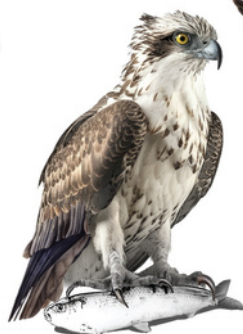
Àguila peixatera Águila pescadora Osprey Pandion haliaetus

Trets diferenciadors: - Les ales són llargues i estretes. - Els tarsos estan emplomallats fins al naixement de les urpes. - Té les plomes de l'ala quasi negres i la coa de to grisenc. - Al ventre presenta dos plomatges diferents que no tenen relació amb el sexe. Plomatge clar: les parts ventrals són blanques, amb la gola i el pit variablement llistats. Plomatge obscur: les parts ventrals són color castanya, amb la gola i el pit variablement llistats. Longitud: 42 - 51 cm Envergadura: 110 - 135 cm