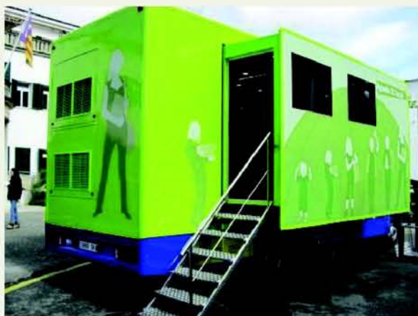
Unitat Mòbil d'A21L del Consell de Mallorca